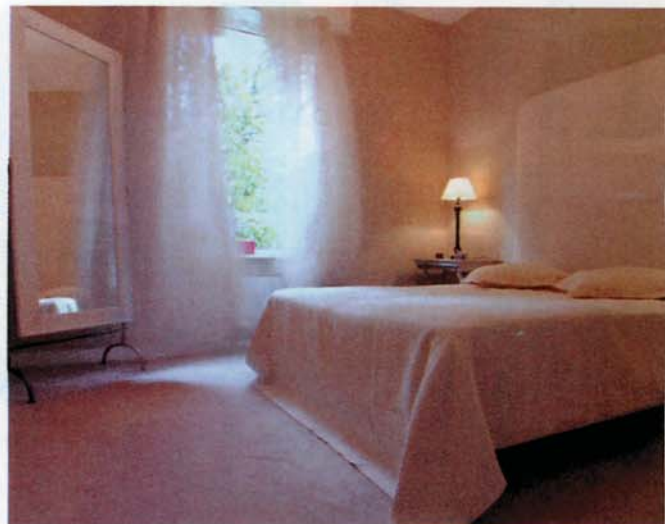
Les fenêtres des coquets appartements de la Villa des anges surplombent la mer.