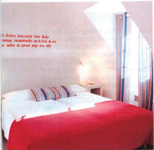
Le poétique hôtel du Centre : des strophes ornent les murs blancs.