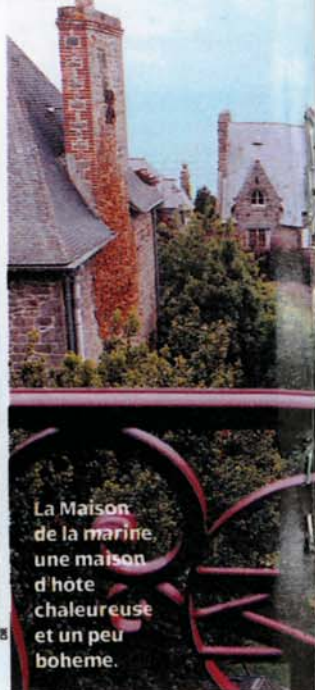
La Maison de la marine, une maison d'hôte chaleureuse et un peu bohème.