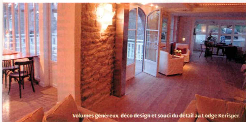
Volumes généreux, déco design et souci du détail au Lodge Kerisper.

A partir de 115 €. Le Palais, Belle-Ile. 02-97-31-80-77. www.chateau-bordeneo.com