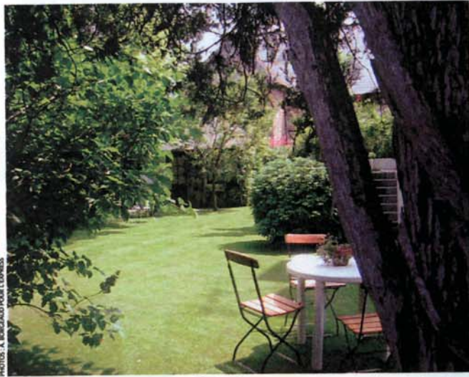
L'été, à l'Ascott Hôtel, les petits déjeuners sont servis dans le jardin fleuri, à l'abri de l'agitation de la cité malouine.