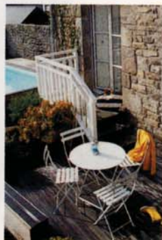
SAC FAÇONNABLE, BOTTES AIGLE, CIRE GUY COTTEN, PHOTOPHORE BOUGIE LA FRANÇAISE.

▲ Claires et calmes, les chambres invitent au repos.