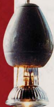
Ces suspensions sont l'œuvre de Iguzzi-Edison, un artiste italien.

porte-fenêtre divise l'espace en jouant subtilement avec la lumière. Comme pour Philippe et Claudie, « la lumière, c'est avant tout l'âme d'un lieu », les éclairages ont été choisis avec soin : petites lampes et abat-jour en opaline diffusent une douce clarté.